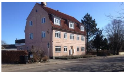
"Slagterbygningen" blev opført i 1946. Inden da, blev der spillet badminton på den ubebyggede grund.

I efteråret 1997 indvies Tingbakkehallen og inden man fik vendt og drejet sig, var der tilmeldt 62 seniorer og 39 ungdomsspillere til badminton. Et kæmpe ryk for sporten og EIF. I de efterfølgende år var der rigtig mange ungdoms- og seniorspillere i afdelingen, men efter godt 10 år, måtte ungdomsafdelingen lukke og slukke, vist mest på grund af ledermangel.